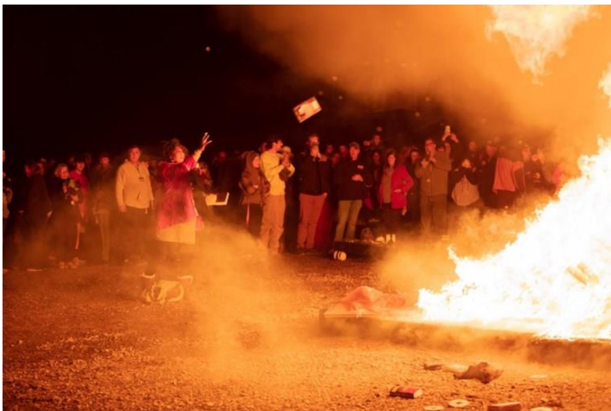
Een boekverbranding in Tennessee, twee weken geleden.