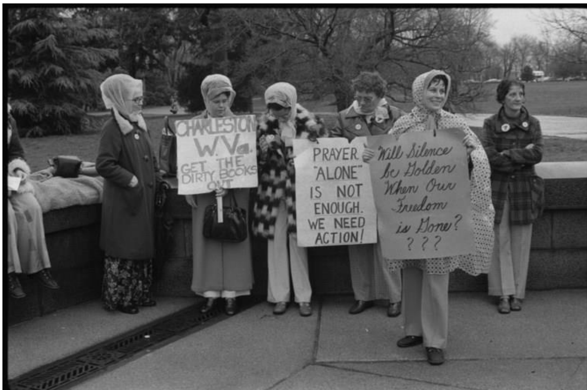
Betogers tijdens de Grote Schoolboekenoorlog in Kanawha County, Virginia (1975).

Het debat over de invloed van boeken op jeugdige zieltjes is niet nieuw. Nooit liep de spanning hoger op dan in 1975, in Kanawha County, Virginia. De beslissing om de boekenlijst voor openbare scholen aan te passen aan de raciaal en cultureel meer diverse tijden (onder anderen James Baldwin en George Orwell werden toegevoegd) schoot de silent majority in het verkeerde keelgat. Toen de vrouw van een fundamentalistische predikant in de onderwijsraad uitvoer tegen de 'antichristelijke, obscene en on-Amerikaanse' lijst, leidde dat tot een protestcampagne en een boycot. Ouders hielden hun kinderen maandenlang thuis, mijnwerkers gingen in staking, twee scholen werden in brand gestoken en schoolbussen werden beschoten. Er werd zelfs een samenzwering verijdeld om een bus vol kinderen te laten ontploffen. De Grote Schoolboekenoorlog is de geschiedenis ingegaan als een aberratie, maar hij speelde zich wel af in één county van één staat.