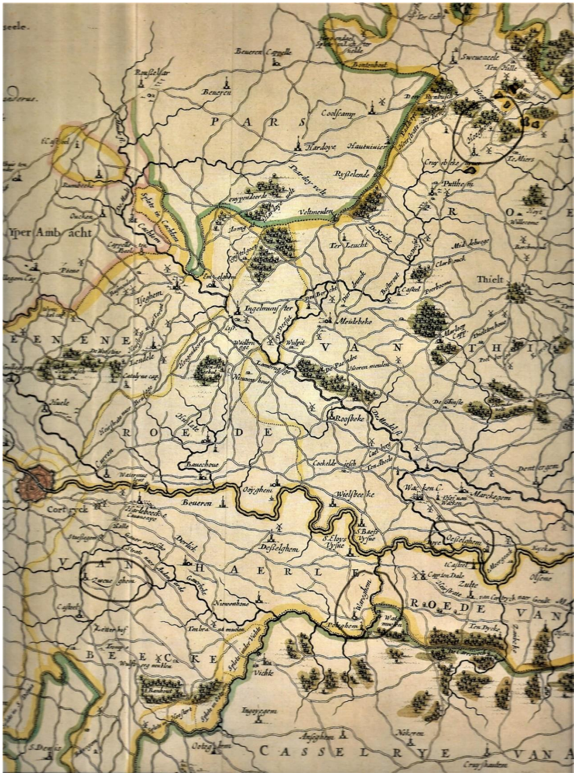
Detail van de kaart Castellania Corturiacensis met aanduiding van gemeentes waar Bossu benoemd werd.